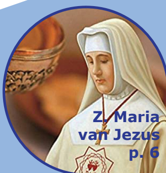
Z. Maria van Jezus p. 6