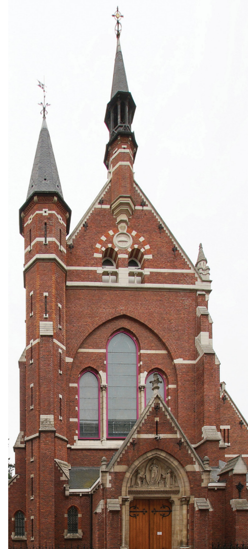
H. Hartbasiliek te Berchem