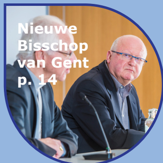
Nieuwe Bisschop van Gent p. 14