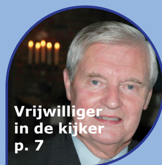
Vrijwilliger in de kijker p. 7