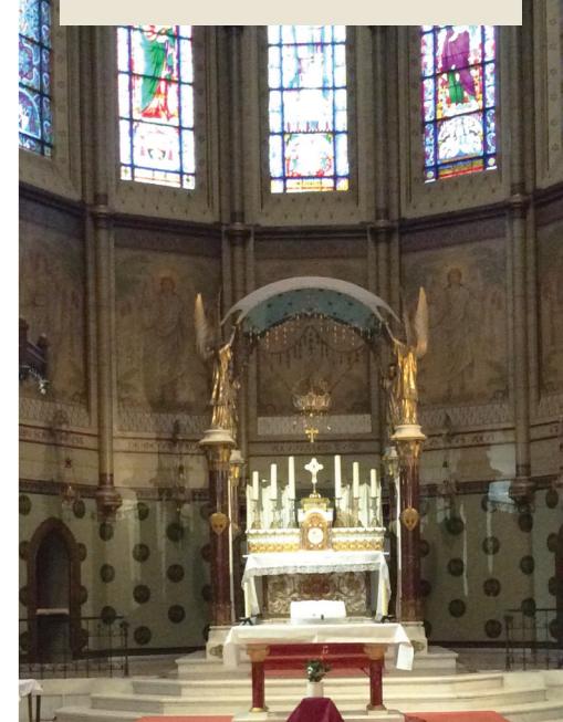
Interieur van de H. Hartbasiliek te Berchem met hoogaltaar voor alijdurende aanbidding.